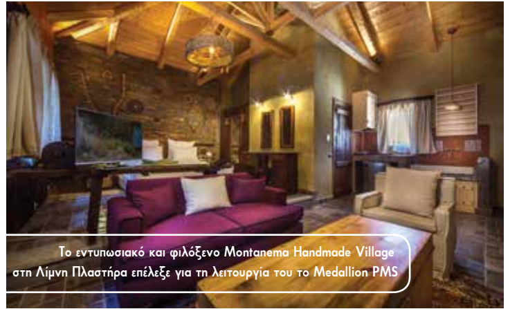
Το εντυπωσιακό και φιλόξενο Montanema Handmade Village στη Λίμνη Πλαστήρα επέλεξε για τη λειτουργία του το Medallion PMS

Αξίζει να σημειωθεί πως το Medallion PMS έχει πλέον εξελληνιστεί πλήρως, με ευθύνη της Sysco A.E., για την ακόμη ευκολότερη λειτουργία του στην αγορά της χώρας μας.